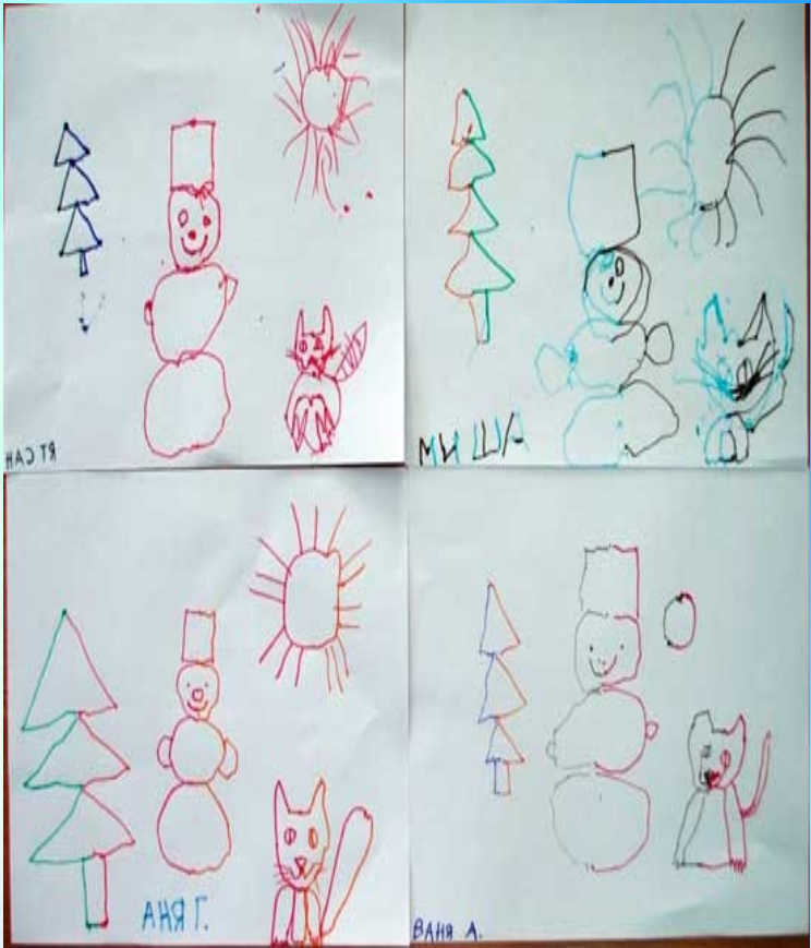
Рисование двумя руками