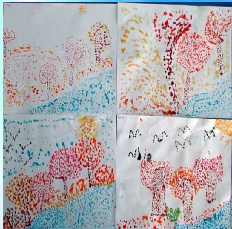
Рисование точками (акварель, фломастеры)