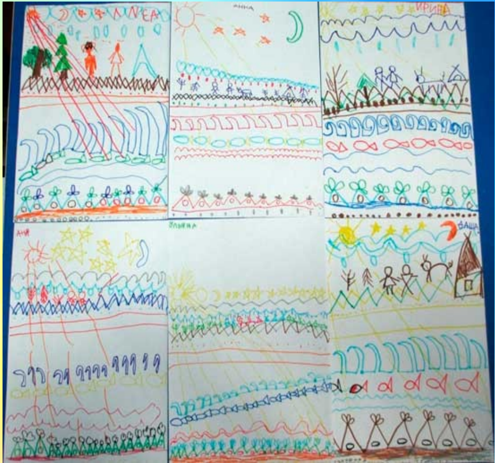
Пиктографические композиции с разнообразными линиями