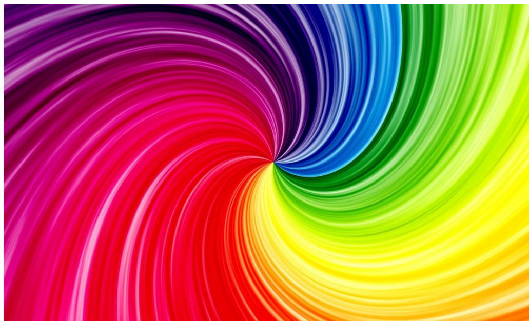
Упражнение с цветом «Отпечатки»

Девочка надела разноцветный плащ и вышла на улицу. Стояла осень, но день был солнечным и ярким. По голубому небу плыли белые облака. Трава была ещё зелёной, а вот листья на деревьях уже покраснели и пожелтели. На дорожках стояли синие лужи. В одной луже плавали оранжевые кленовые листья, принесённые ветром. Вдоль дорожки росли фиолетовые астры. Они качали головкам и от ветра. Вдруг в небе появилась радуга. Она была яркой, разноцветной. Девочка хотела запомнить, из каких цветов состоит радуга, но та растаяла так же быстро, как и появилась. Девочка очень расстроилась, но в это время трава у её ног зашевелилась, и её окружили крошечные гномики. Девочка посмотрела на их колпачки: красный, оранжевый, жёлтый, зелёный, голубой, синий, фиолетовый — и тут же вспомнила, из каких цветов состоит радуга. Она засмеялась и посмотрела в высокое голубое небо. А когда она опустила голову, гномики в разноцветных колпачках уже разбежались в разные стороны. Девочка помахала им рукой и пошла домой. Дома она нарисовала букет разноцветных цветов.